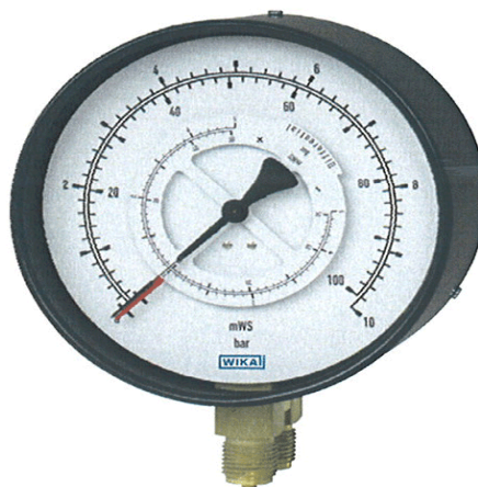
Differenzdruckmessgerät Typ 711.12